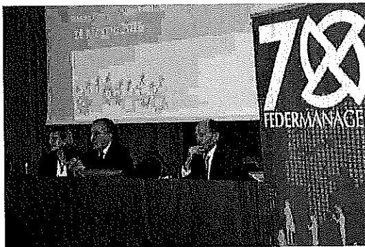
Dall'alto le premiazioni, la platea e i relatori